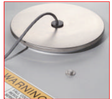
Etanchéité de la sonde

Si votre produit est sensible à la contamination par balles, le système Ultrasonex est fait pour vous et vous garantit une réduction du risque d'usure des toiles.