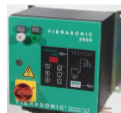
Coffret de commande