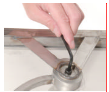
... et de démontage