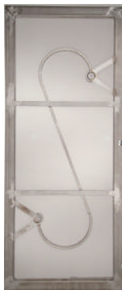
Tamis Rotex Ultrasonex

Le système Rotex Ultrasonex opérant une influence tout en douceur sur la toile, sans aucune action mécanique, la durée de vie de la toile s'en trouve augmentée de manière significative.